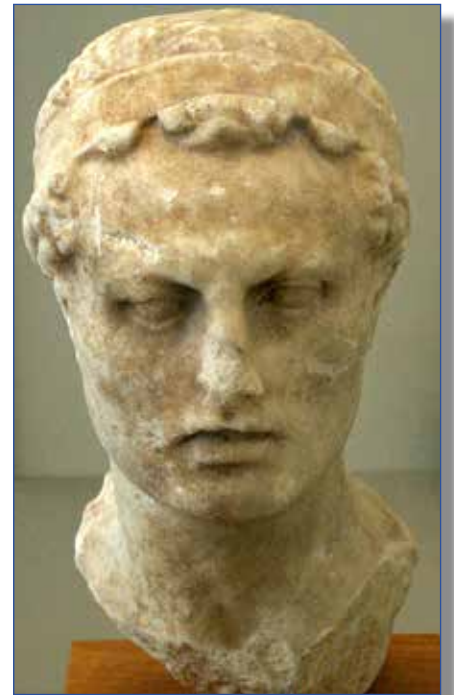
Antiochos Epifanes ( https://creativecommons.org/licenses/by-sa/3.0 )

– Vad är då det djupaste sambandet mellan tempelinvigningsfesten och julen? Ett svar ger aposteln Paulus i Romarbrevet 11:17–18, där han uppmanar den kristna församlingen i Rom att besinna sig innan de dömden den del av det judiska folket som inte delade deras tro på Jesus: ”Om nu några av grenarna har brutits bort, och du som är en vild olivkvist har blivit inympad bland dem och fått del av det äkta olivträdets näringsrika rot, då ska du inte förhäva dig över grenarna. Om du förhäver dig ska du veta att det inte är du som bär roten utan roten som bär dig.” Judar och kristna bärs och närs alltså av samma rotsystem, men de kristna får inte glömma att de kommit in sist genom det som Abrahams, Isaks och Israels trofaste Gud har gjort genom det folk som han först anförtrodde med sitt Ord och sitt förbund. En kristen teologi enligt vilken judendomen helst borde ha försvunnit in i kristendomen går hand i hand med den hellenistiska kulturens totalitära anspråk och angrepp under Antiochos Epifanes. Låt mig citera några ord som avslutar kapitlet om tempelinvigningsfesten i Tid för Gud :