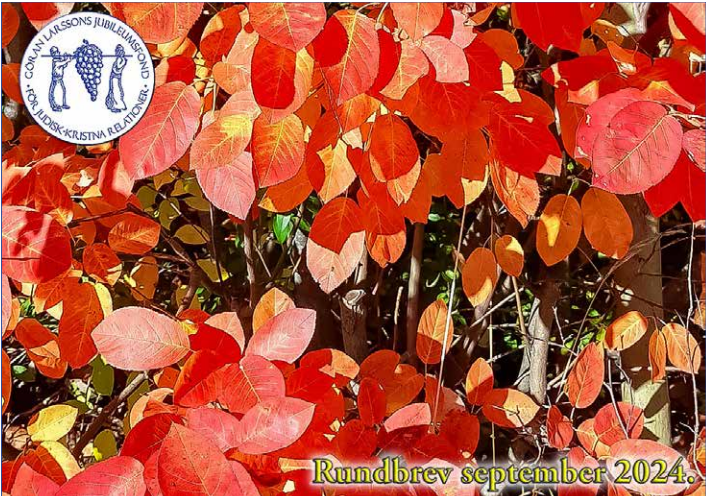
Hösfärgerna kommer....