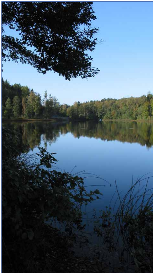
Vassbosjön, Ljungskile.