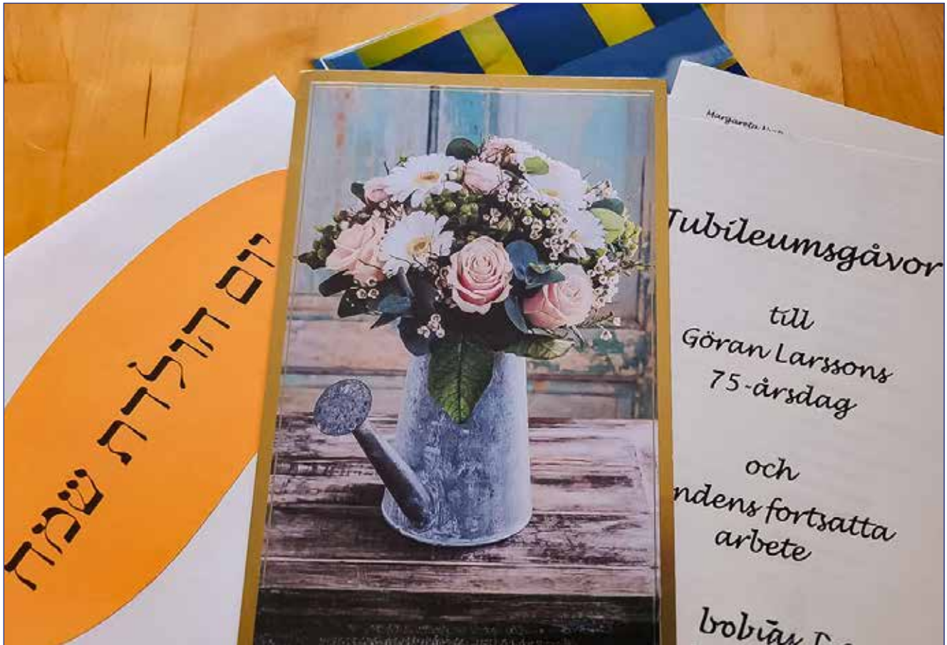
Konvolutet med alla namn.

Kanske minns någon att jag i det förra nyhetsbrevet kallade denna sommarkurs för en "jubileumssommarkurs". Men medan jag var i Hong Kong i april skickade vår styrelse ut ett särskilt brev med överskriften "Nu har vi jubileum i Jubileumsfonden". Anledningen var att det ju i år faktiskt är 25 år sedan Jubileumsfonden instiftades i samband med min 50-årsdag, vilket i sin tur alltså innebär att jag nu fyllt 75 år. Det brevet fick följder som är den främsta anledningen till denna hälsning.