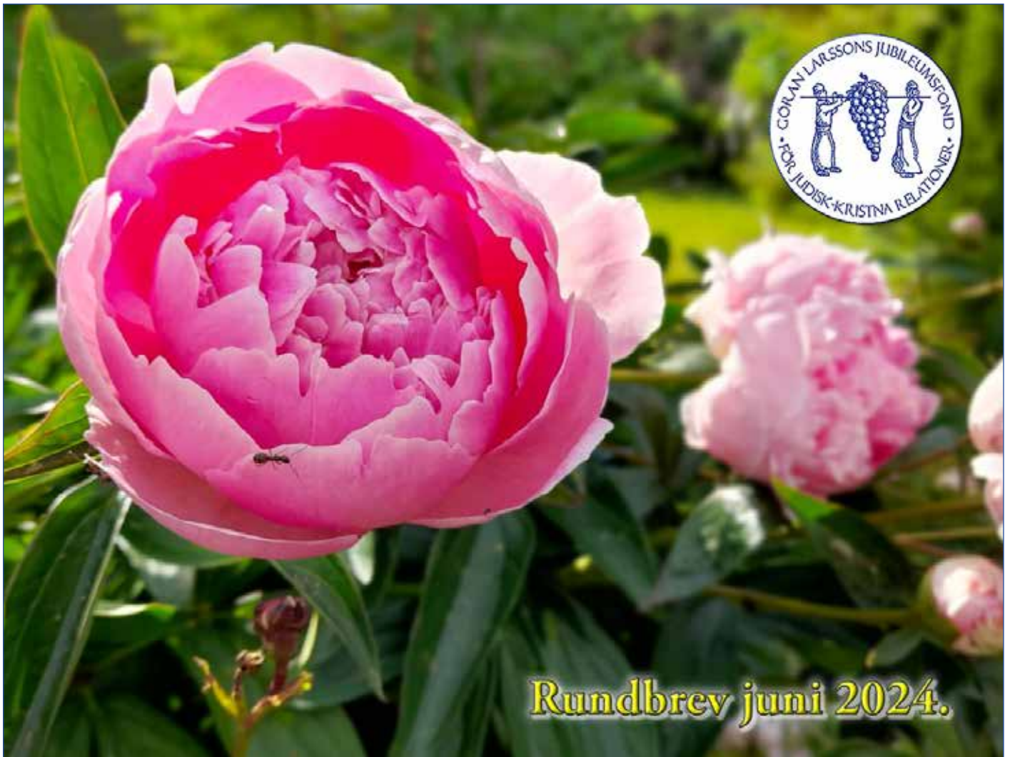
Nu blommar pionerna...